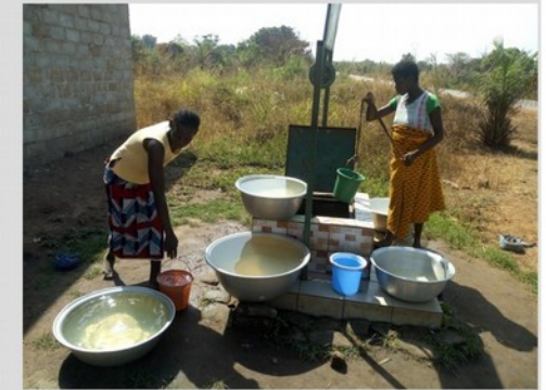
Puits maçonné avec poulie pour exhaure