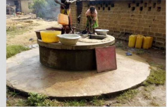
Puits grand diamètre équipé d'une PMH