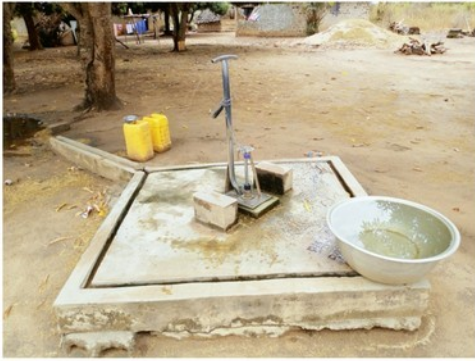
Équipé d'une Pompe à Motricité Humaine (PMH)