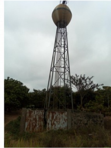
Pompe motorisée alimentant un réseau autonome