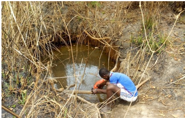
Urgence Eau - Rapport village (2019)

Un marigot à Kouassiblékro-N'gbassou (18 janvier 2019)