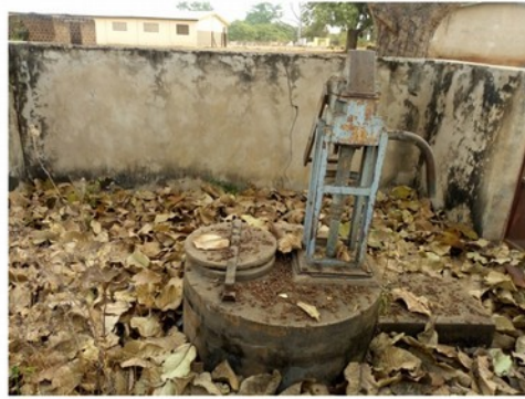
PMH en panne abandonnée