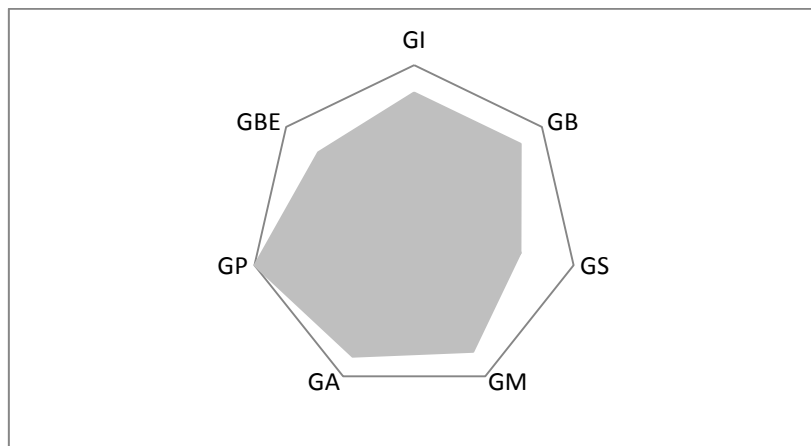
Figure 18 : Graphique figurant le score d'élevage, suivant la classification des sept G, sous la forme d'un graphique radar.

Le graphique est un outil de communication, facile d'accès, pour établir un échange de qualité entre le vétérinaire et l'éleveur. Les points de gestion à modifier en priorité auront les scores les plus bas. La lisibilité des résultats de la visite est facilitée.