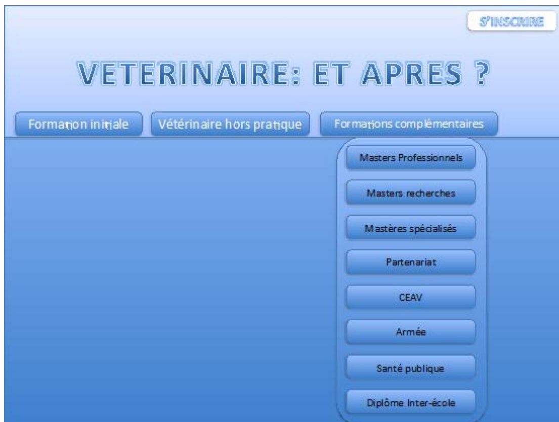
Figure 54 Aperçu de la partie information du site internet ‘vétérinaires et après ?