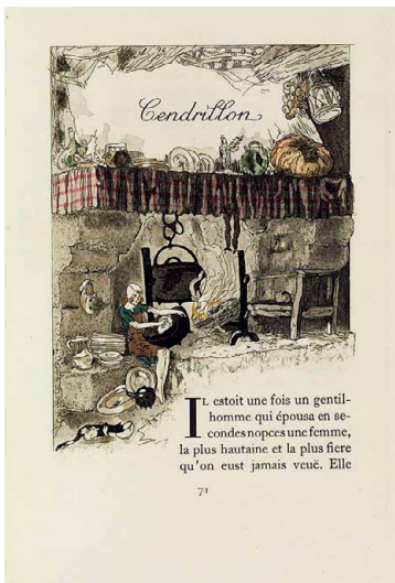
Illustration de Jacques Touchet pour les Contes de Perrault . Paris, 1930 BnF, Livres rares, Rés. p. Y2. 1375 © ADAGP Paris 2001