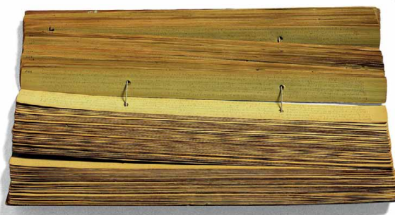
Atharvana, Inde, XVIII e siècle BnF, Manuscrits orientaux, sanskrit 179

1 Retrouver le goût, l'odeur, la saveur du livre dans sa matérialité sensible , fragile, irrégulière : livres de peau, de papyrus, de tissu, d'écorce ou de papier, surfaces lisses ou rugueuses à toucher, espaces à caresser de la main ou des yeux, enchaînement des pages à feuilleter, livre fermé dont le texte reste caché, livre secret bruissant de « ces beaux et cachez mystères, adombrés sous l'écorce de l'écriture » évoqués à la Renaissance par Blaise de Vigenère ; livre ouvert invitant à la conversation ou au voyage de page en page avec autant de haltes et d'arrêts que d'élan ; livres blessés, usés par le temps ou par la lecture, livres éclatants presque intouchables sous leurs riches reliures d'or ou d'ivoire, livres majuscules porteurs selon Borges d'une « immensité d'espérance », livres minuscules faits pour être emportés avec soi dans la montagne. On se souvient peut-être du héros de Pluie d'été de Marguerite Duras dont la vie bascule à la découverte dans une cave d'un sombre livre qu'il ne comprend pas mais dont le monde inconnu l'appelle irrésistiblement. En amont du texte il y a cette matérialité-là, ce poids du livre entre les mains, cette lumière qui s'en dégage obscurément.