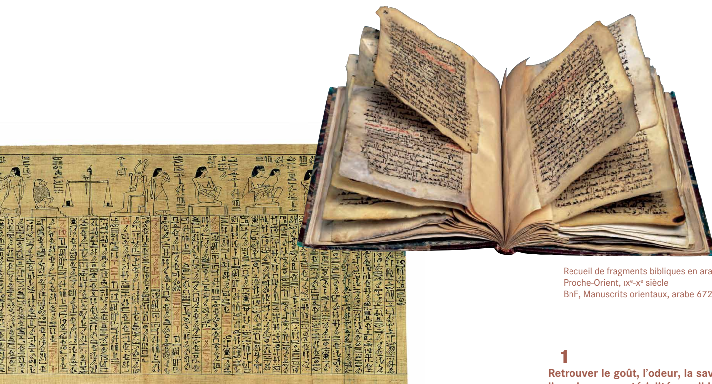
Recueil de fragments bibliques en arabe Proche-Orient, IX e -X e siècle BnF, Manuscrits orientaux, arabe 6725

le livre semble bien s'offrir à eux comme une forme disponible pour mettre en scène les figures inattendues de leur lien au monde. C'est en nous appuyant sur ces expériences qu'au moment de créer, pour les enfants et les adolescents, un nouvel outil de découverte du livre et de la lecture, nous avons défini quelques axes et stratégies pédagogiques visant à ouvrir des chemins d'accès au livre.