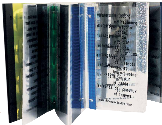
Miroir aux alouettes urbaines Michel Butor, Bertrand Dorny, 1998