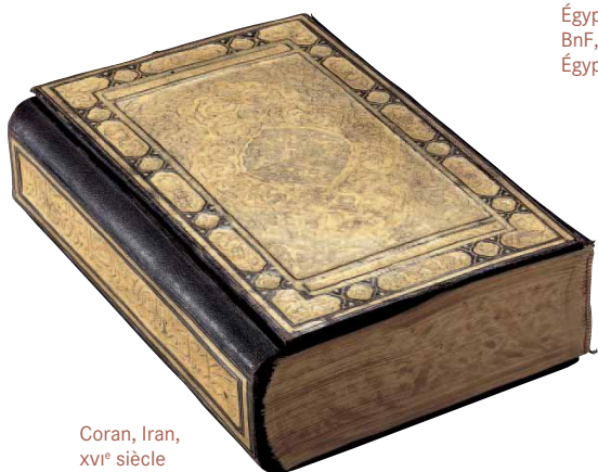
Coran, Iran, XVI e siècle BnF, Manuscrits orientaux, Smith- Lesouëf 215