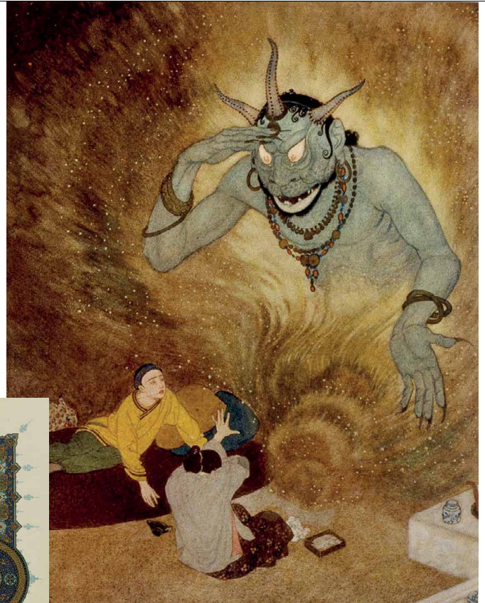
Les mille et une nuits [Le Génie de la lampe] In « Sindbad le Marin et d'autres contes des mille et une nuits » Illustrateur: Edmond Dulac Paris, H. Piazza, 1919 BnF, Rés 4-Z DON-206 (12)

Entendre les textes, leur redonner vie par la parole, par le théâtre et la mise en scène (décors, postures, récitation), par le mime, le dessin ou peut-être la danse.