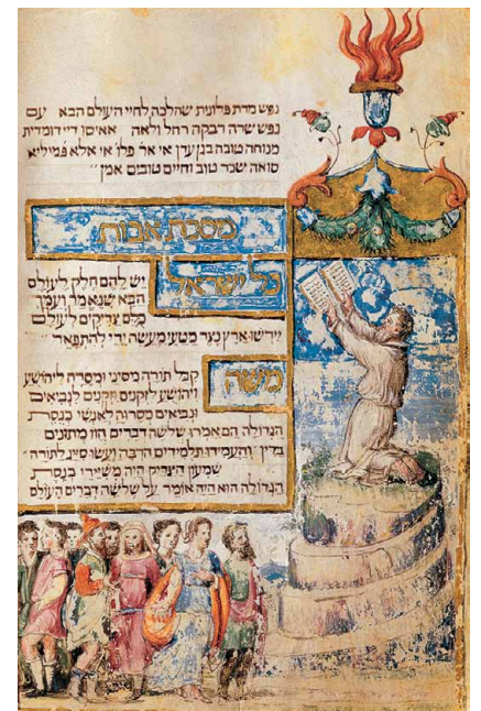
Haggadah [Ferrare], 1583 BnF, Manuscrits orientaux, hébreu, Smith-Lesouéff 250

Dans la tradition biblique, selon le livre de l'Exode, le « premier » livre est écrit du doigt de feu de Dieu: c'est Moïse qui le reçoit sur les hauteurs du Sinaï, il a la forme de Tables de pierre écrites au verso et au recto. Moïse de colère les brise en descendant de la montagne et le « deuxième » livre est un mélange de composante humaine (Moïse cette fois polit les Tables) et divine (c'est Dieu qui réécrit, à moins que ce ne soit Moïse dans le ressouvenir de la graphie divine, le texte ne permet pas de trancher!).