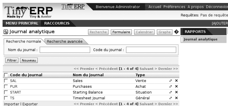
Figure 9-3 Création d'un journal analytique

Pour définir vos journaux analytiques, utilisez le menu suivant : Finance/Comptabilité>Configuration>Journaux>Journaux analytiques .