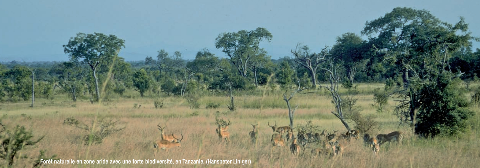
Forêt naturelle en zone aride avec une forte biodiversité, en Tanzanie. (Hanspeter Liniger)